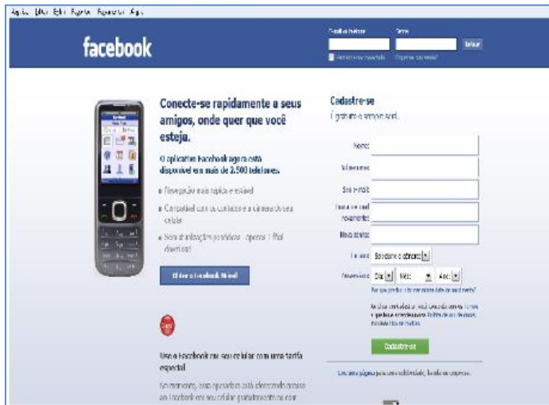
Figura 1. Tela inicial do Facebook

As Figuras 1 e 2 que são as páginas iniciais dos sites citados.