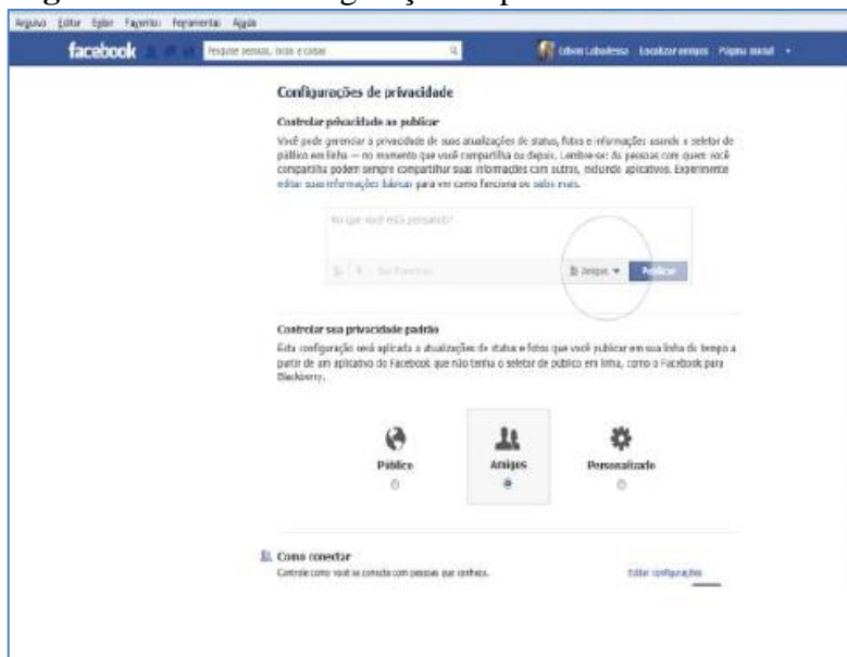
Figura 3. Tela de configuração de privacidade do Facebook