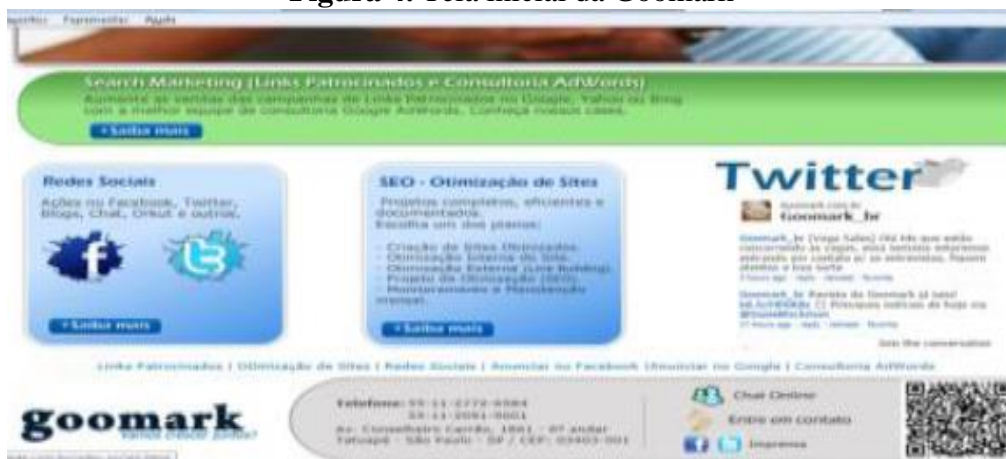
Figura 4. Tela inicial da Goomark